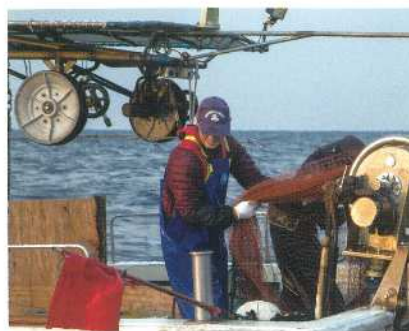
ごち網漁／江口漁港