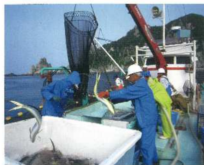
定置網水揚げ風景