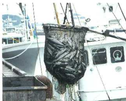
枕崎漁港の水揚げ風景