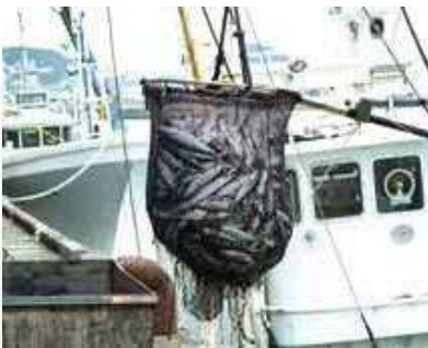
枕崎漁港の水揚げ風景