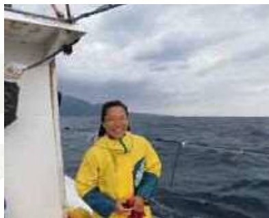
トビウオロープ曳／屋久島