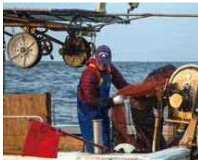
ごち網漁／江口漁港